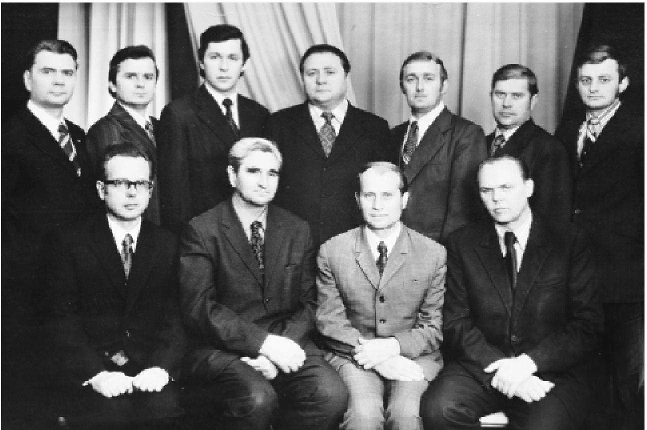
Випуск курсантів кафедри