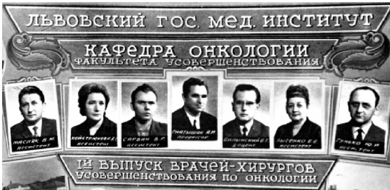
Перший педагогічний колектив кафедри онкології та медичної радіології

щина, Болгарія і т.д.). Результати їх досліджень публікувалися у провідних онкологічних журналах світу: «European Journal of Cancer», «Annals of Oncology», «European Journal of Surgical Oncology», «Onkologie», «Proceedings of American Society of Clinical Oncology», «Anti-Cancer Drugs», «Bulletin Cancer», «Breast Cancer Rese-