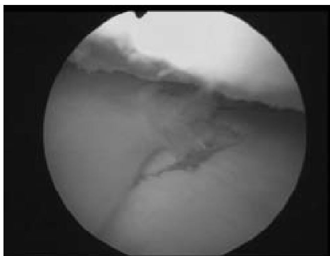
Рис. 2 — Артроскопія колінного суглоба, зона пошкодження хряща внутрішнього виростка стегнової кістки

Fig. 3 — MRI of the knee joint, sagittal projection, lesion in the posterior horn of the medial meniscus